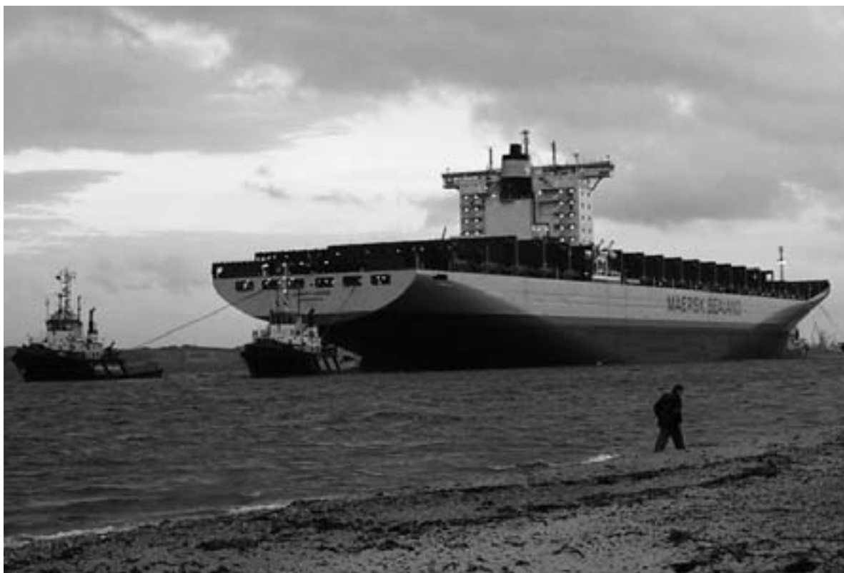
Et af de tidligere containerskibe trækkes ud gennem Gabet.

Tommerup Tryk ApS Højeløkkevej 19, 5690 Tommerup Telf.: 64 76 16 00.